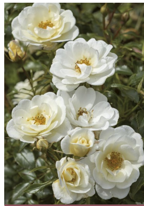
Bijenweelde® Ivory wit / blanc