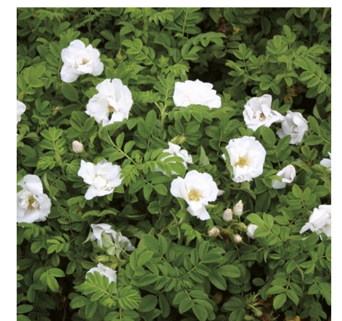
White Pavement® wit / blanc