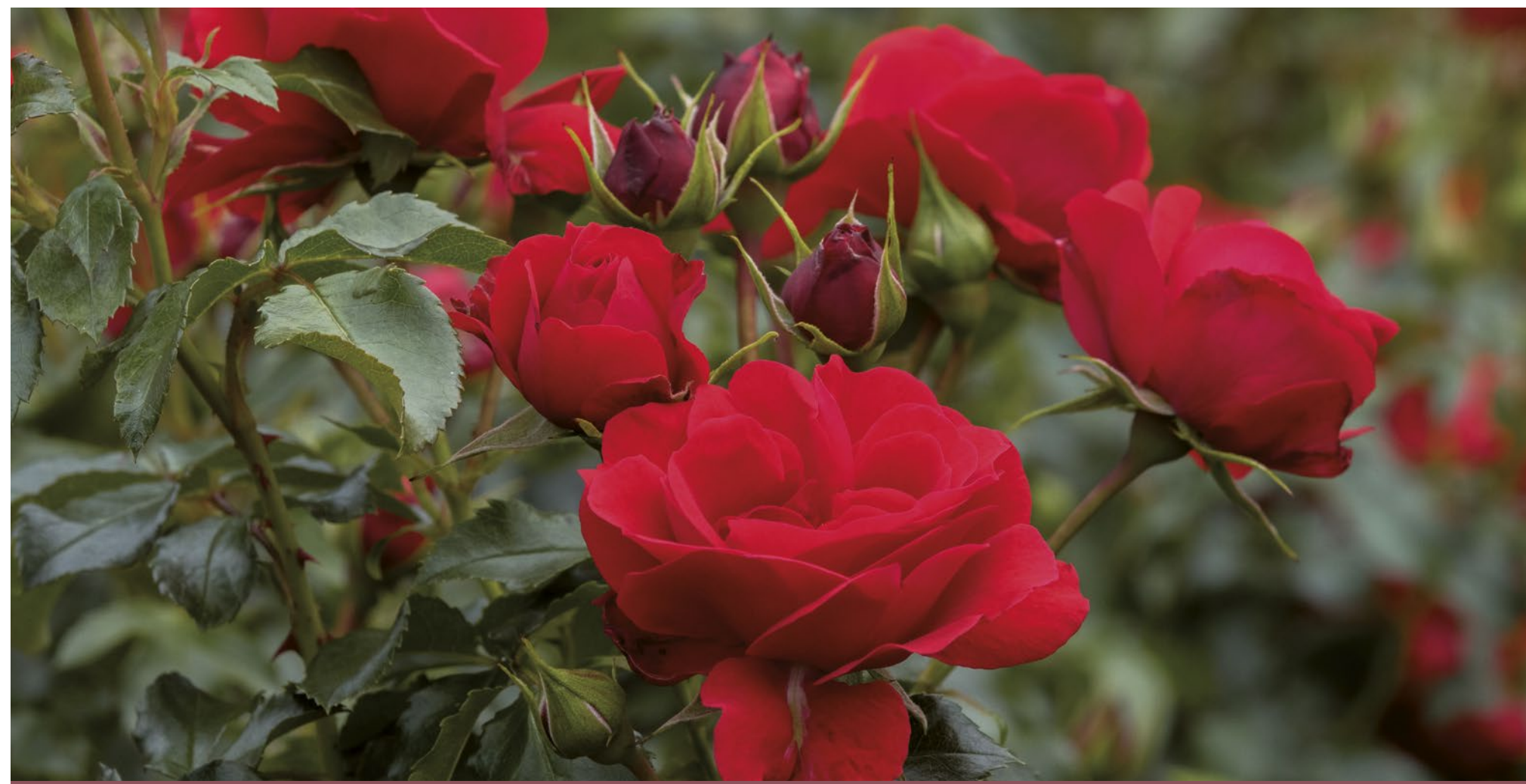
Pepino® zachtrood / rouge tendre