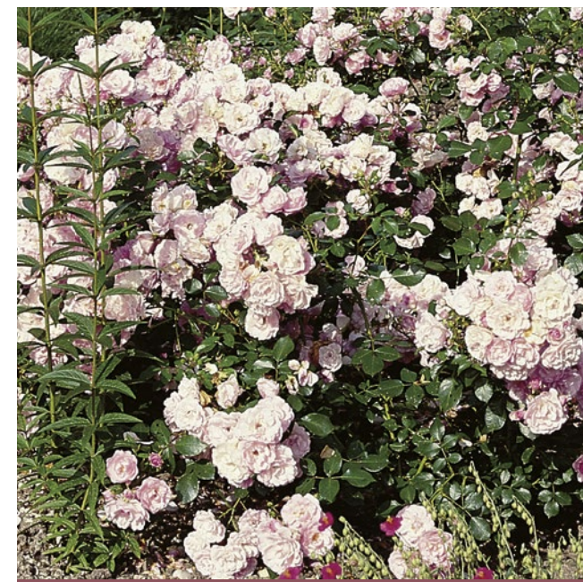
Pearl Mirato® zachtroze / rouge tendre