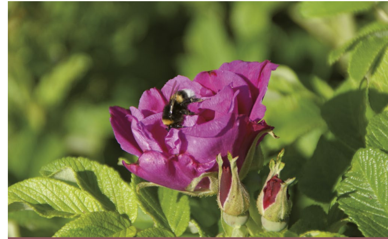
Scarlet Pavement® rood / rouge