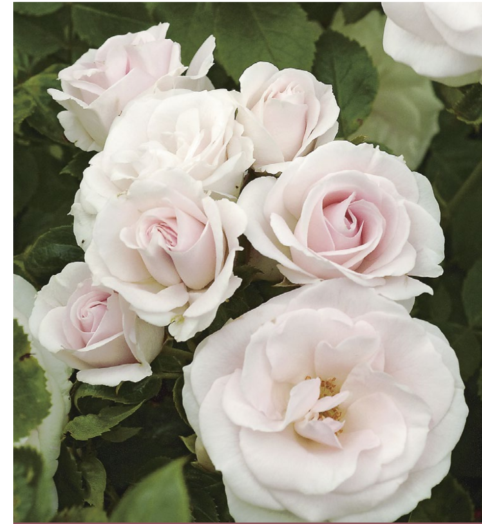
Aspirin Rose® wit tot witroze / blanc à blanc-rose