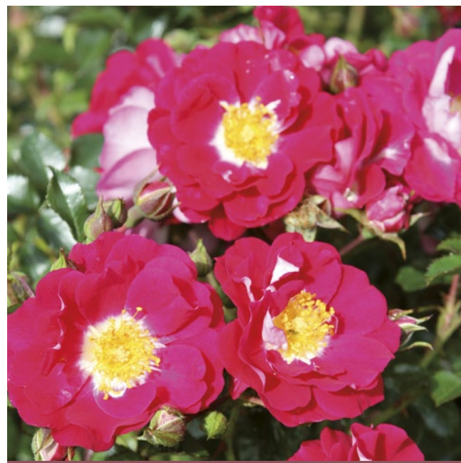
Lipstick® violetruze / rose violet