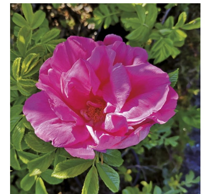
Pink Pavement® roze / rose