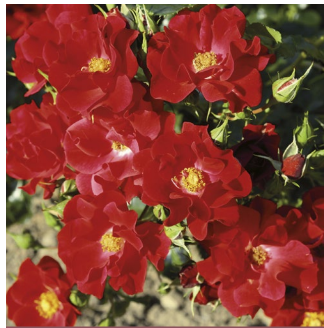
Matador® rood / rouge