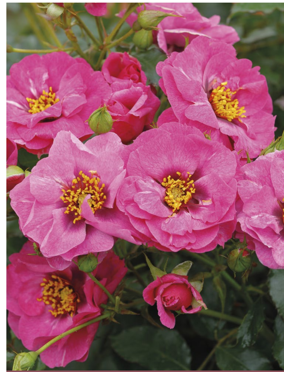
Oriente Djamilla® roze lichtpaars / rose-pourpre pâle