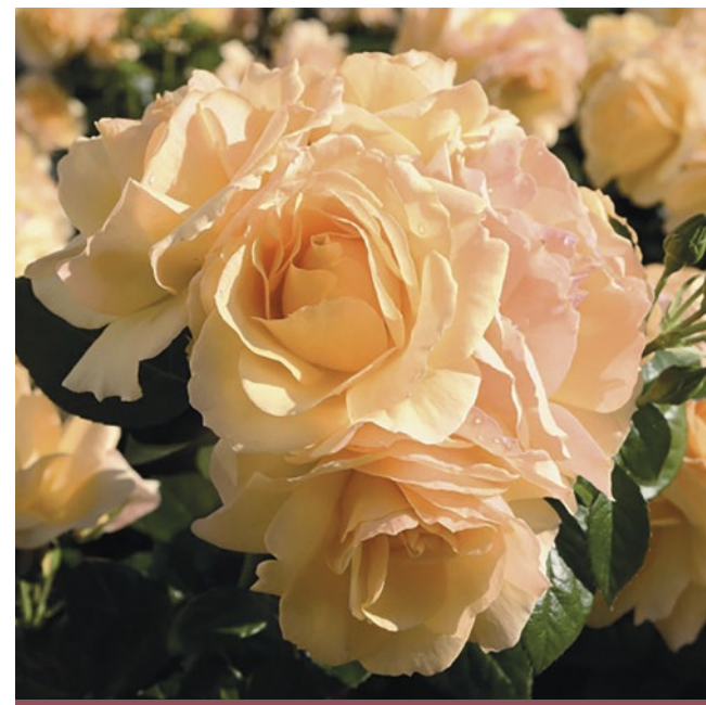
Hansestadt Rostock® amber - abrikoos / couleur abricot ambré