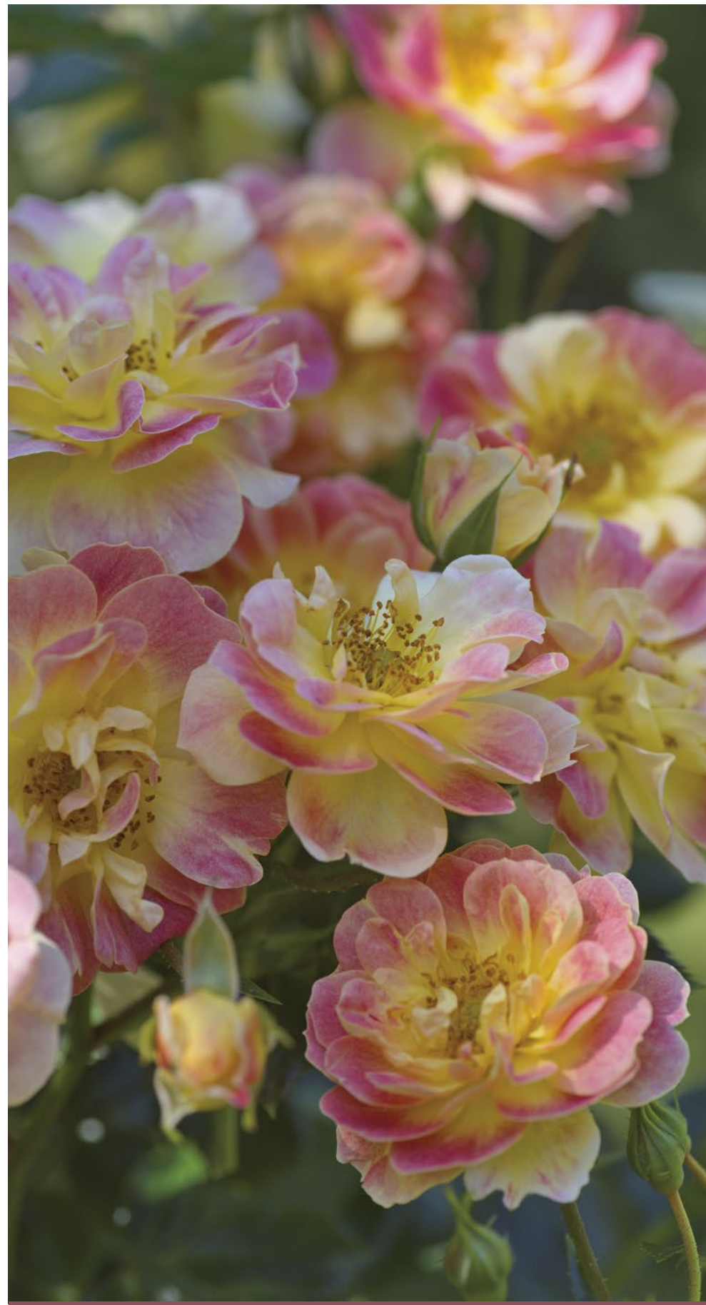
Bijenweelde® Fruity meerkleurig geel oranje / bicolor jaune - orange