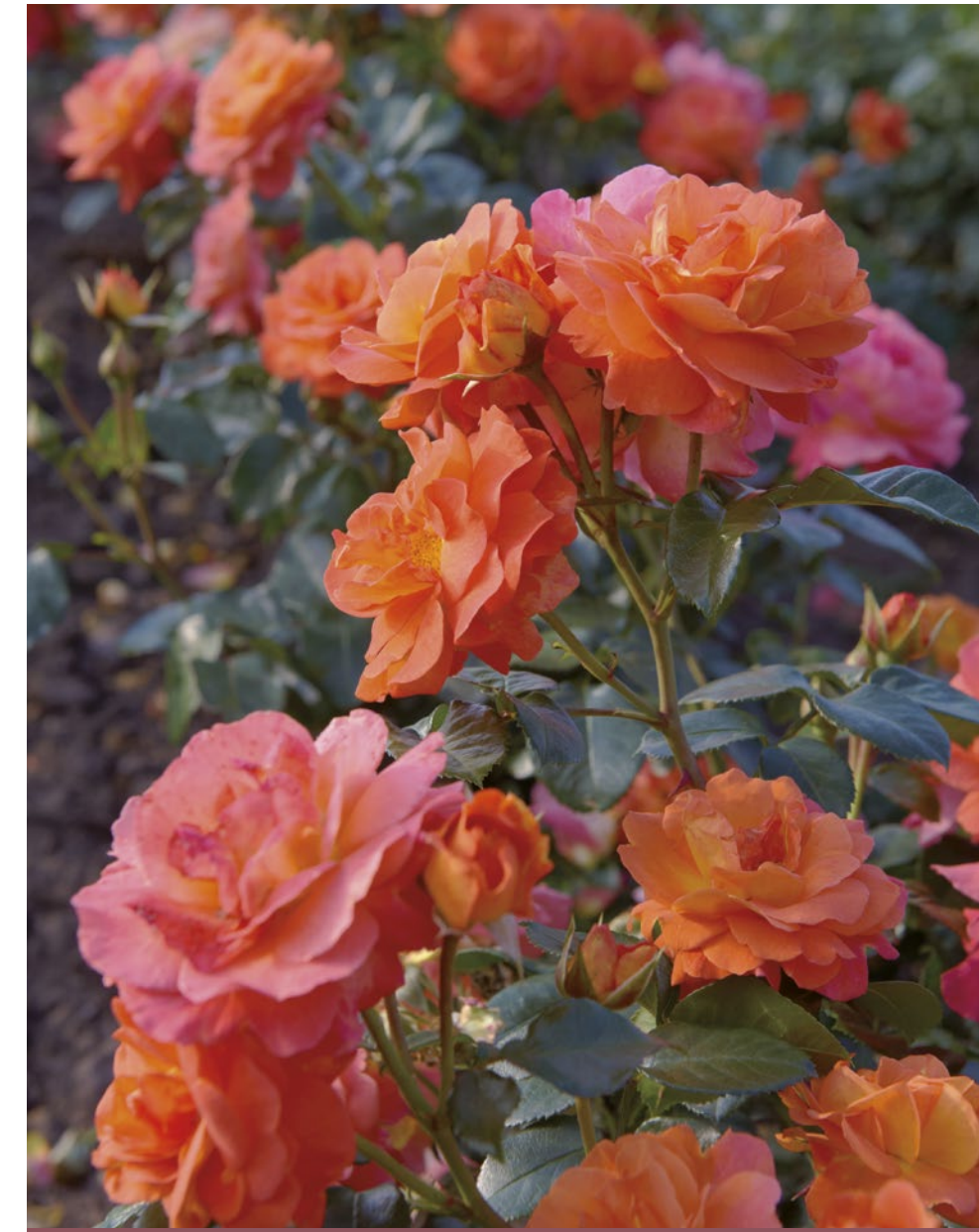
Morning Sun® oranje / orange