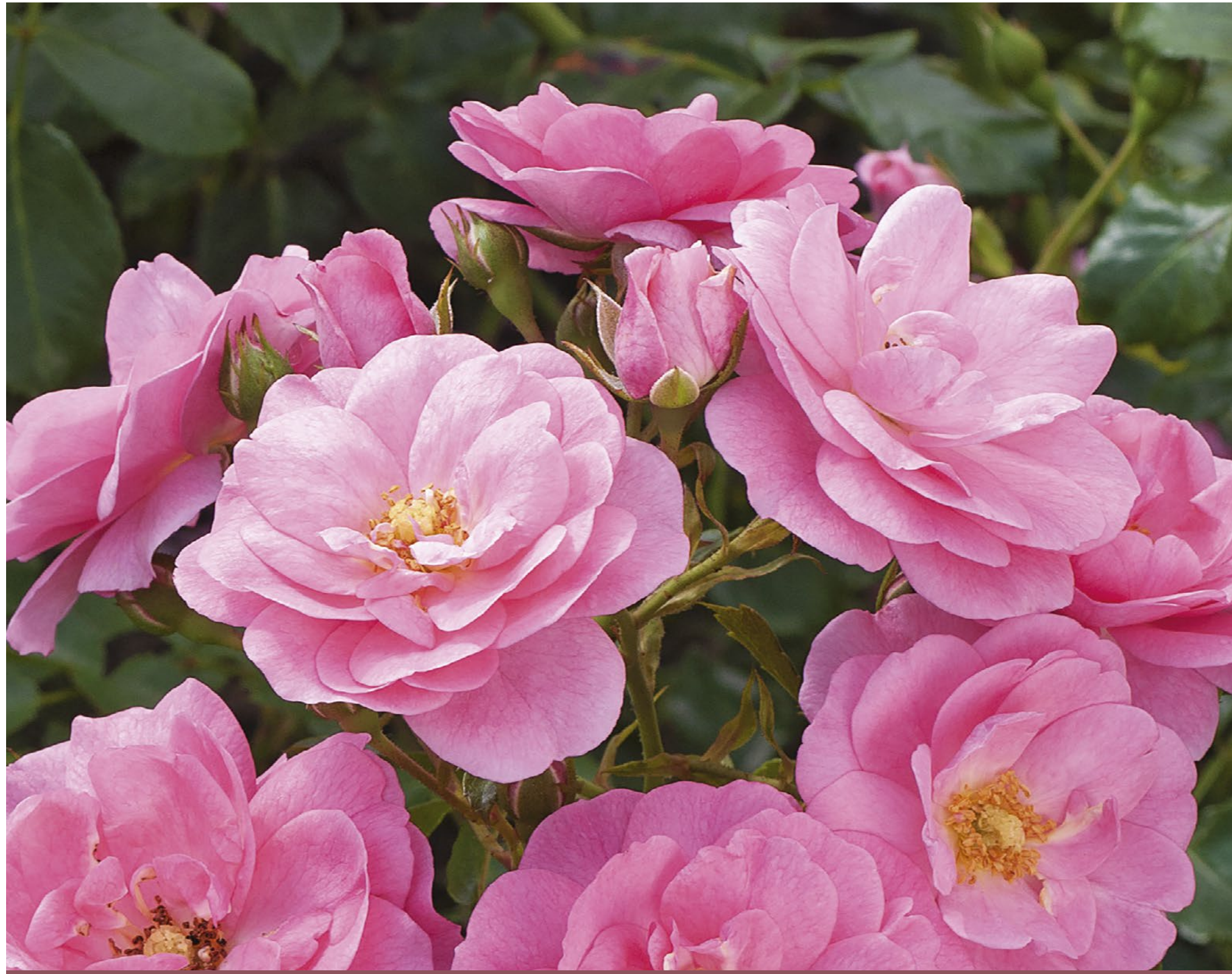
Mirato® donkerroze / rose foncé