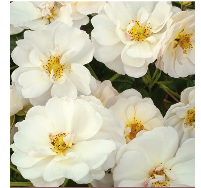
Schneekönigin® wit / blanc