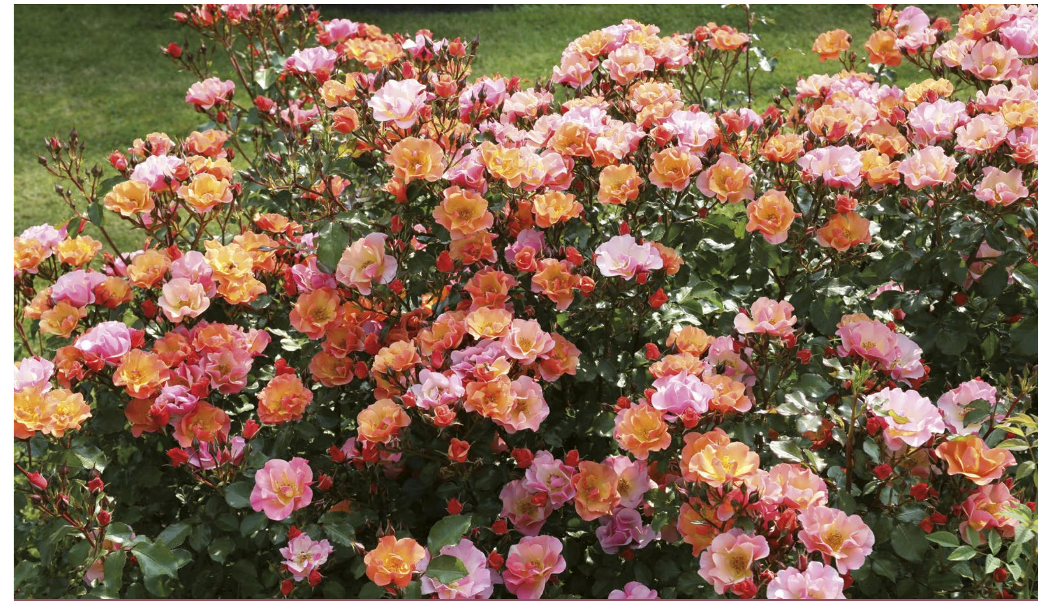
Jazz® koper perzikkleurig / Couleur pêche cuivrée