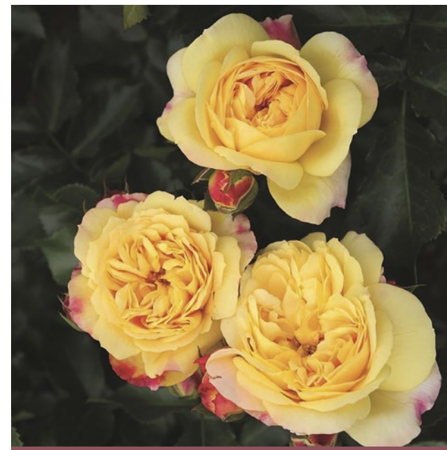
Lampion® heldergeel / jaune vif