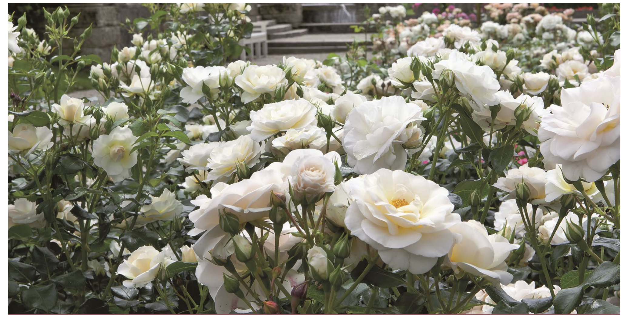
Sirius® wit / blanc