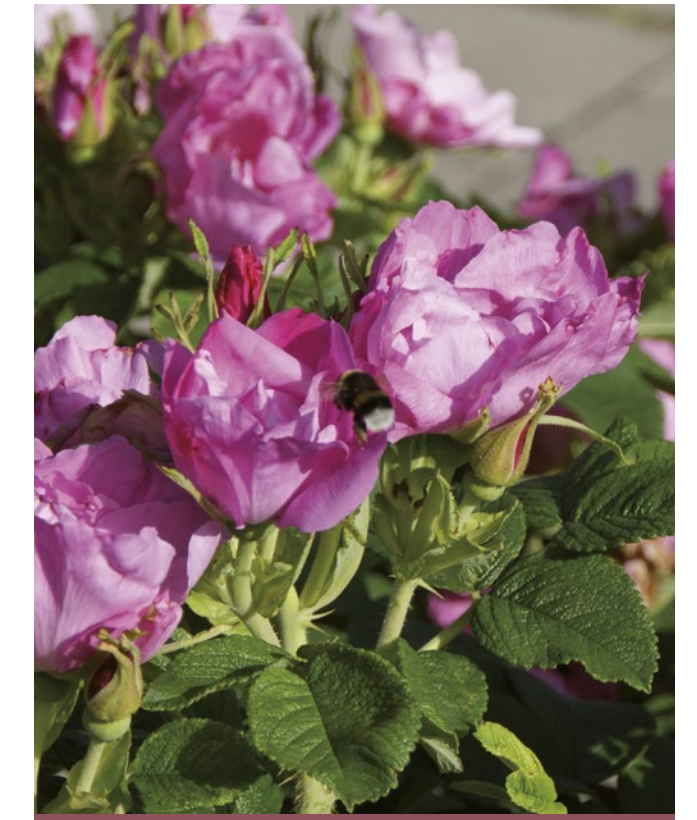
Foxi Pavement® roze / rose