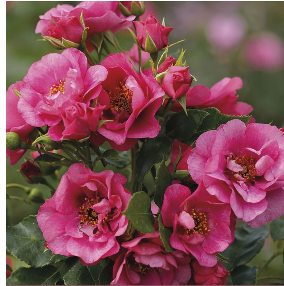
Oriente Aladdin® donkerroze / rose foncé