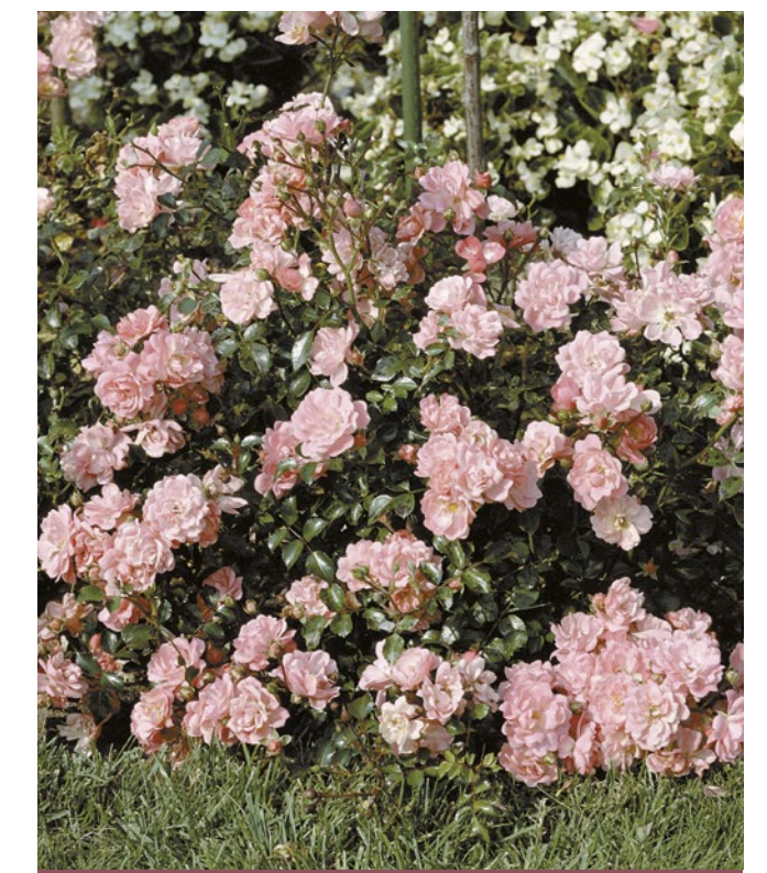
Satina® zacht roze / rose tendre