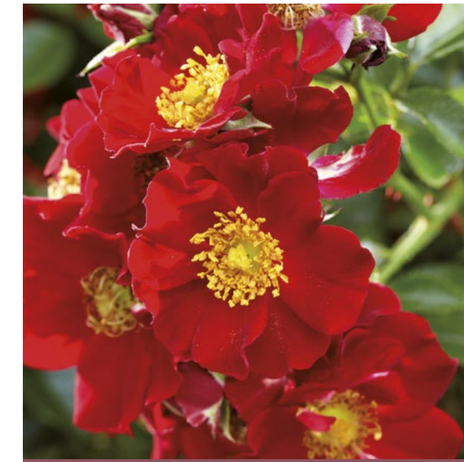
Bijenweelde® rood / rouge