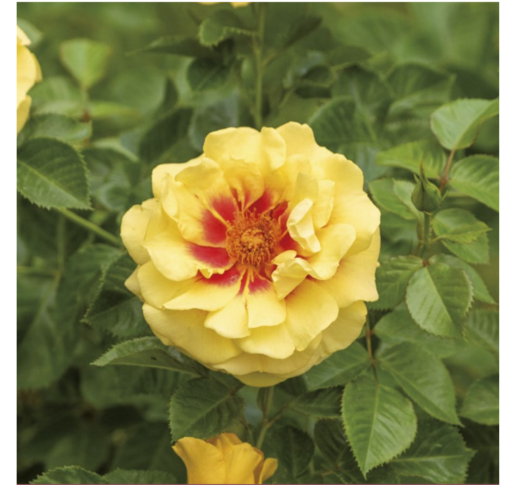
Oriente Aylin® geel / jaune