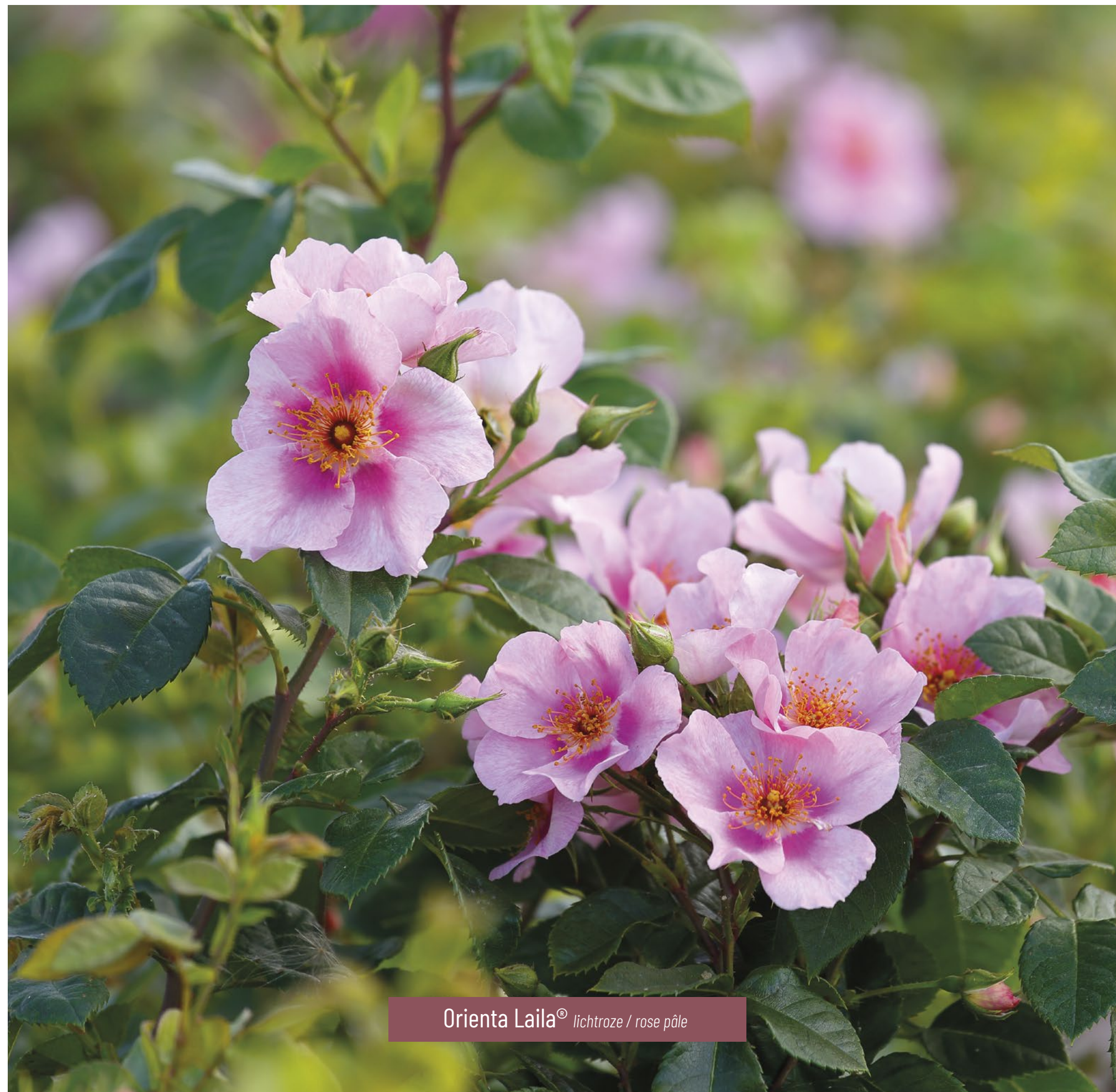
Oriente Laila® lichtroze / rose pâle

Caractéristiques : • Forme de croissance arquée Utilisation : • Convient comme haie • Pour bordures, solitaire, petites groupes