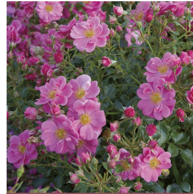
Bijenweelde® roze / rose