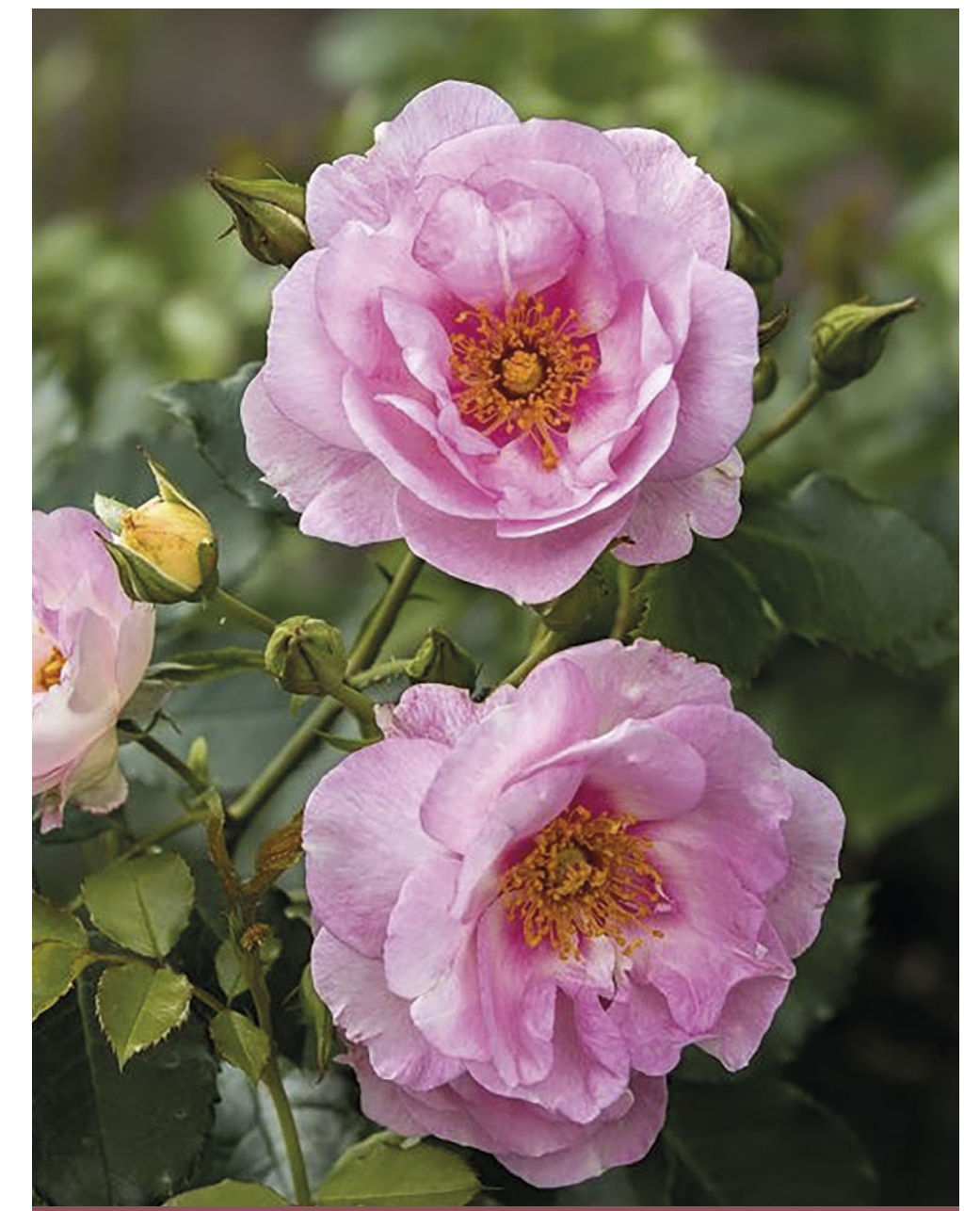
Oriente Magnolia® lichtroze / rose pâle