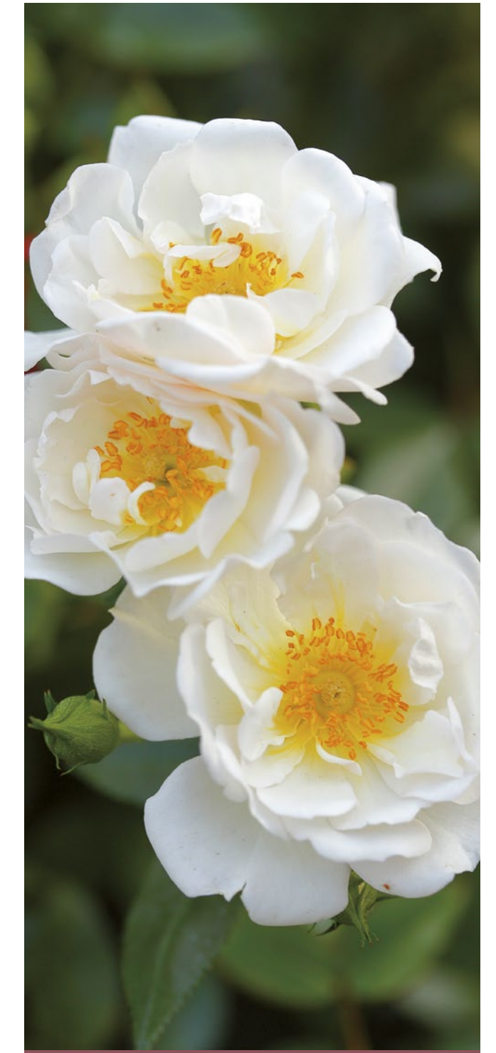
Bijenweelde® wit / blanc