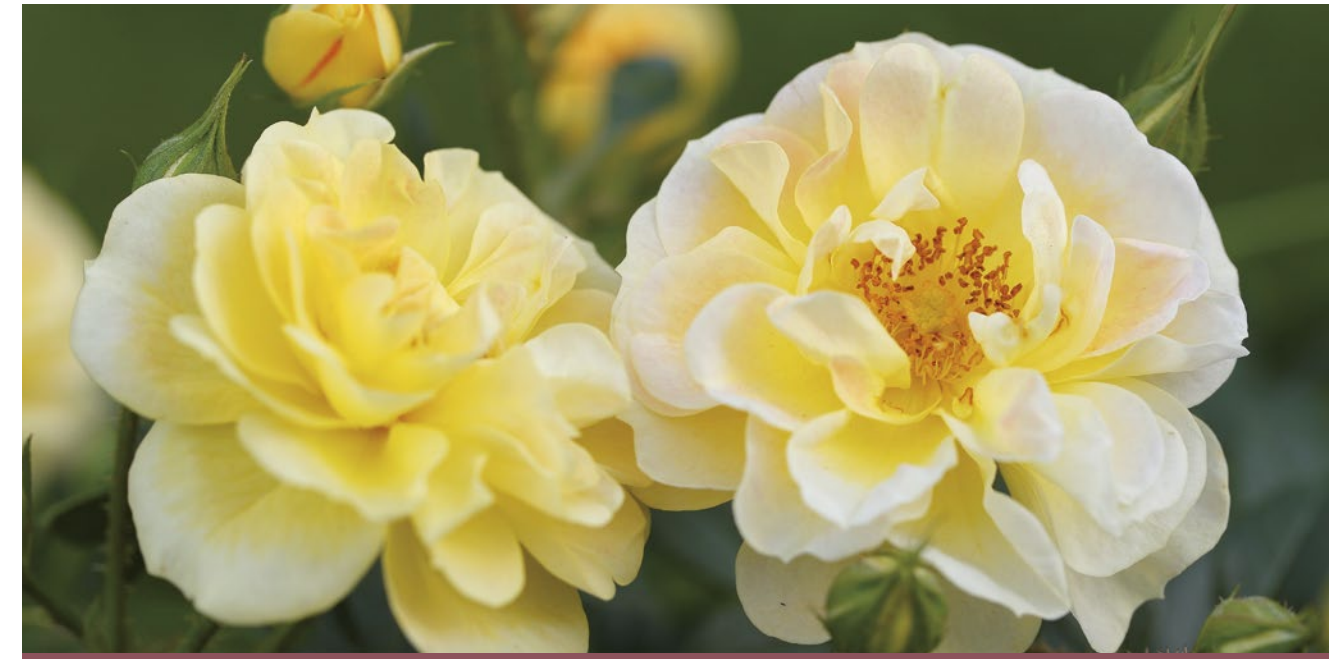
Bijenweelde® geel / jaune