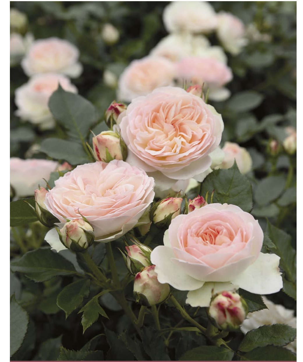
Pastella® roze / rose