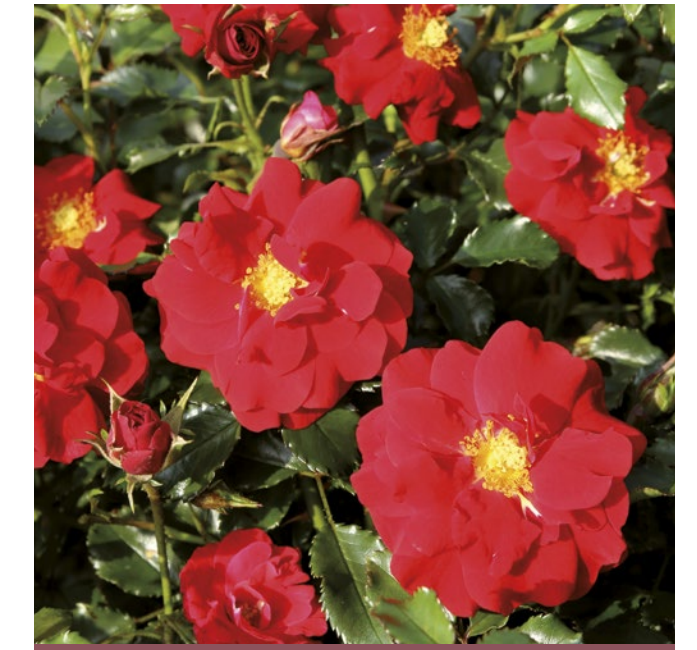
Salsa® rood / rouge