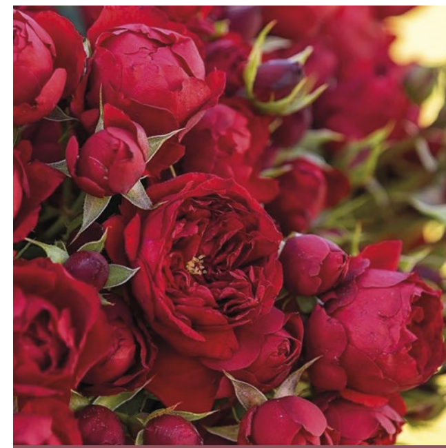
Manora® rood / rouge