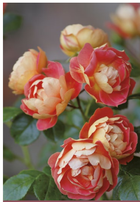
Bijenweelde® Mango oranje / orange

meerkleurig roze - lichtabrikoos / bicolor rose - tendre abricot