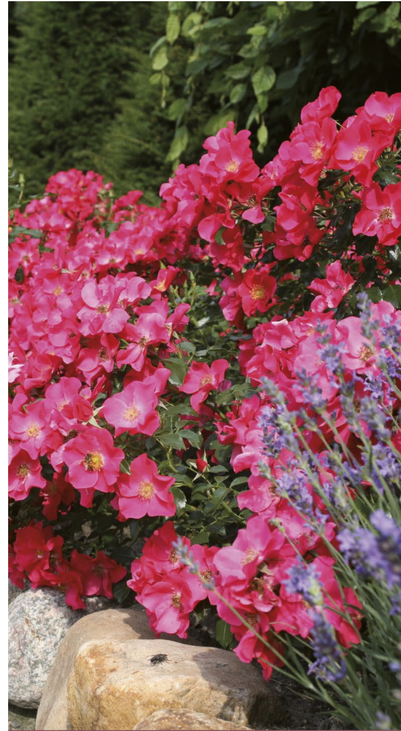
Stad Rome® fuchsia roze / fuchsia rose